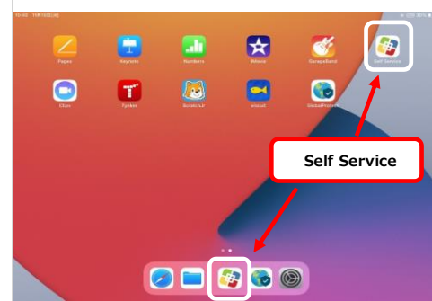
iPadホーム画面 (イメージ)