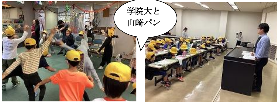
学院大と山崎パン