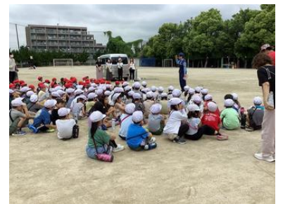
1年生 交通安全教室

♡♡掲載した写真は、千里新田小HP「せんしん日記」からの引用です。活動の様子はぜひブログをご覧ください♡♡