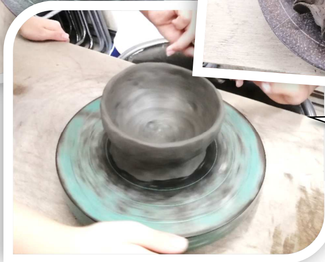
思い思いの作品を作りました！