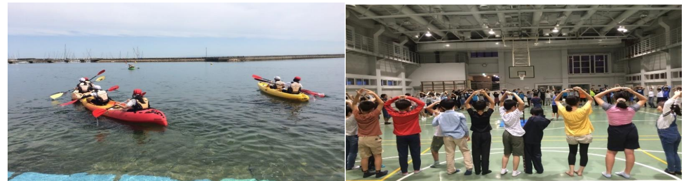
6月1日(土)にぎやかネット開講式