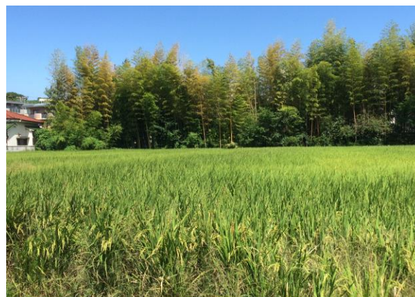
10月中旬の稲刈りが楽しみです