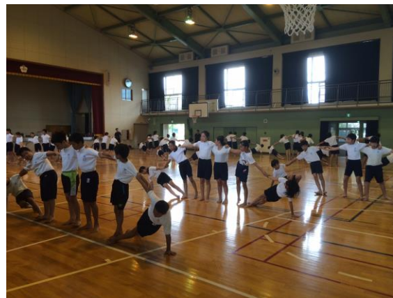
6年生 団体演技「組体操」の練習

6月に5年生が農業体験で植えたお米がすくすくと育っています。この間、地域の方々に管理していただいています。ありがとうございます。10月15日に稲刈りを予定しています。運動会での「権六おどり」、2年生の「敬老会」での発表、地域教育協議会フェスティバルなど、地域とつながる「学び」やその成果の発表が多い2学期です。あらためて地域の皆様のご支援とご協力に感謝申し上げます。教室での日々の学習とともに、校内外での行事や体験を通じて子どもたちがさらに大きく、逞しく成長してくれることを願ってやみません。