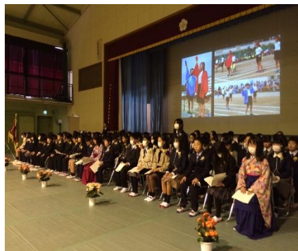
第146回卒業式 103名の卒業生が学び舎の山一小を巣立ちました。

結びになりましたが、この一年間、登下校の安全を見守って下さったPTA・地域の皆様、「子ども110番の家」の皆様、授業・体験活動でご協力いただいた地域・ボランティアの皆様、そして本校の教育活動にご理解・ご協力いただいた保護者の皆様に厚くお礼申し上げます。ありがとうございました。おかげさまでこの一年間で子どもたちは心身ともにたくましく成長しました。来年度も子どもたちが笑顔で生き生きと学校生活を送れるように、引き続きご支援賜りますようお願い申し上げます。