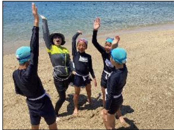
一人ひとりが目標を達成しました