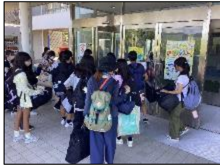
入所式は暑さ対策の為室内で行いました