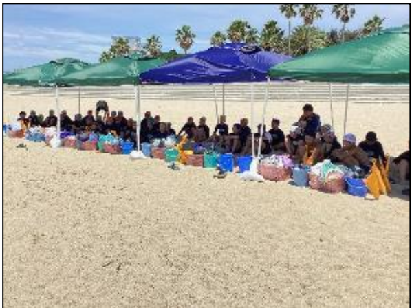
仲間の声援に励まされました