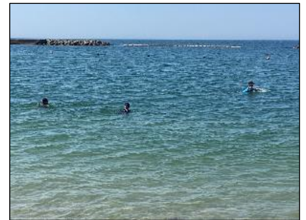
今までの練習の成果を発揮できました!