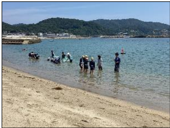
各班に分かれて水慣れをします ドキドキ・ワクワクが止まりませんでした!