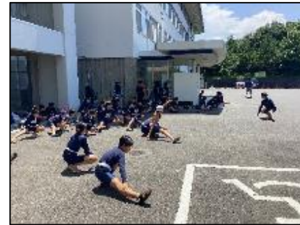
出発前の体操・水遊びをしてから海へ向かいました