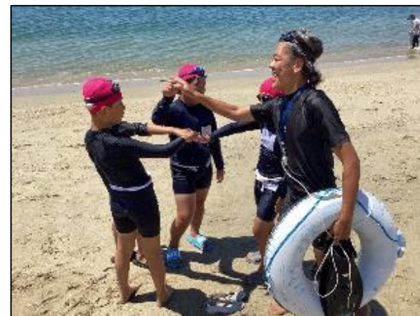
距離泳前に円陣を組んで気合をいれます